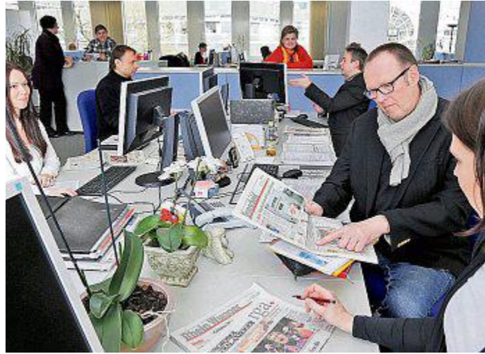
Am Newsdesk werden die Zeitungsseiten gebaut. Täglich üben die RGA-Macher eine eigene Blattkritik.

Der RGA lädt Sie ein. Von 10 bis 16 Uhr bitten wir Sie in unsere Redaktionsräume in der Remscheider City zum Frühschoppen. Kommen Sie mit den Redakteuren ins Gespräch. Und verfolgen Sie, wie Reporter arbeiten, wie ein Newsdesk funktioniert, wie also eine moderne Redaktion dafür sorgt, dass Nachrichten via Internet und Social Media verbreitet und danach umfangreich aufbereitet in die Tageszeitung gelangen.