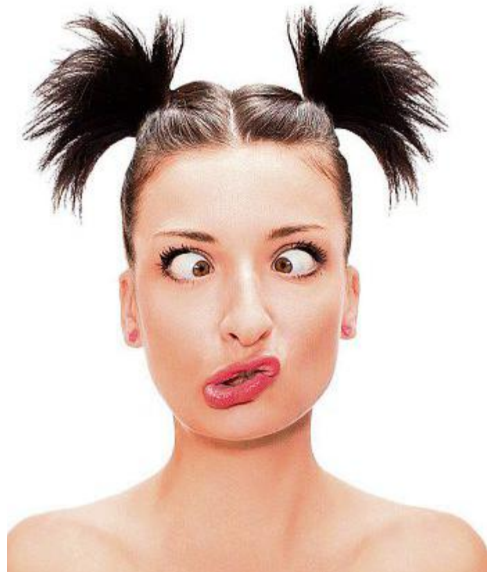
Es muss nicht immer ernst sein.

! meebox GmbH, Hindenburgstr. 17 10 bis 14 Uhr